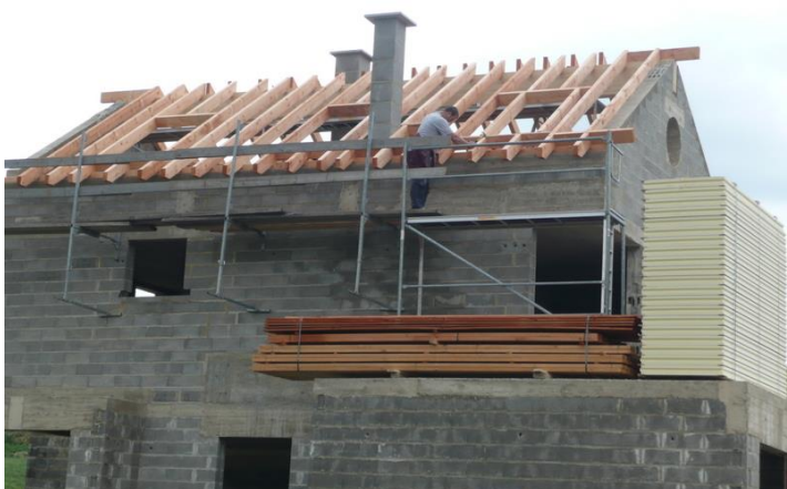
Charpente en route