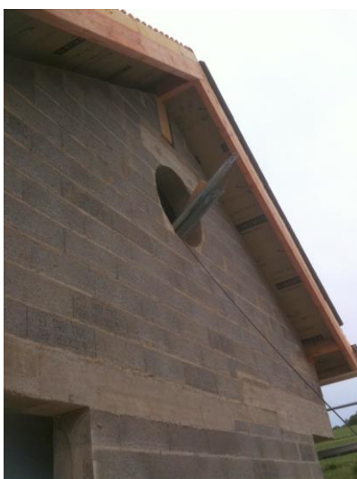
Rive avec dépassant