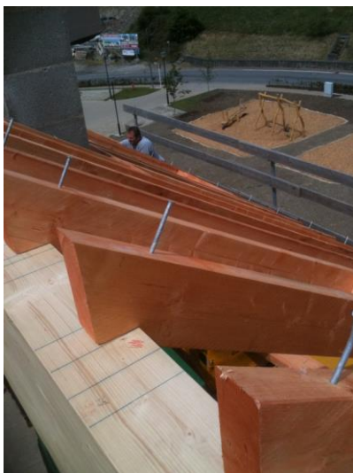
Monter une charpente